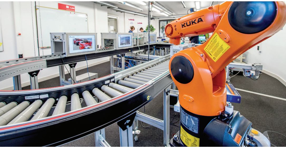
Bild 1: Lernfabrik im Forschung- und Anwen- dungszentrum Industrie 4.0.

Anbindung (zumeist mittels Bluetooth) die gezielte Bereitstellung von Informationen sowie Übermittlung von Benachrichtigungen (auch mittels haptischer Rückmeldungen) und wird damit eher zur Einwirkung (wenngleich nur mittelbar) auf den Prozess genutzt. Die Interaktion kann dabei sowohl Maschine zu Mensch als auch Maschine zu Maschine umfassen. Für jeweilige Umgebungen können kontextrelevante Informationen bereitgestellt werden. Haptische Sensoren ermöglichen die Erfassung des Bewegungsablaufs. Darüber hinaus bieten sich beispielsweise im Einsatzfeld der Feinmechanik optische Sensoren an, um Helligkeitsinformationen zu ermitteln und die Hintergrundbeleuchtung entsprechend anzupassen [6].